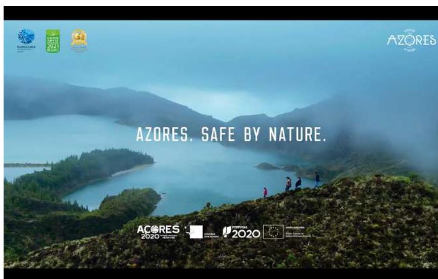
Figura 5 - Vídeo da campanha promocional "Azores Safe by Nature" | 2021