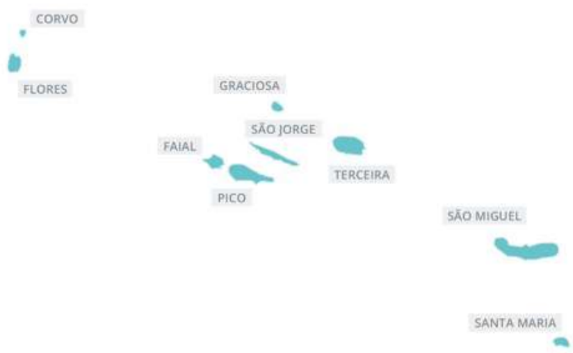
Figura 1 - Região Autónoma dos Açores

A Região Autónoma dos Açores localiza-se no Atlântico Norte, ao longo de uma faixa com cerca de 600 quilómetros de extensão. As nove ilhas do arquipélago são de origem vulcânica e dividem-se em três grupos geográficos: o Grupo Oriental, composto por Santa Maria e São Miguel, o Grupo Central pelas ilhas Terceira, Graciosa, São Jorge, Pico e Faial, e o Grupo Ocidental pelas ilhas Corvo e Flores.