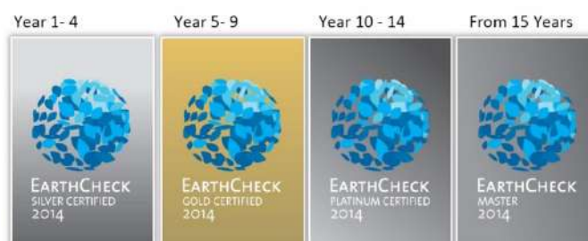
Figura 6- O normativo da EarthCheck define que todos os anos o destino deve demonstrar conformidade e constante evolução dos critérios de sustentabilidade. Apenas em 2024 a Região está 'habilitada' a alcançar a certificação de Ouro.

Pela crescente importância que o setor turístico vem assumindo na cadeia económica da região, à semelhança do que acontece a nível mundial, o Governo dos Açores decidiu submeter-se à Certificação dos Açores como destino turístico sustentável, reconhecido pelos critérios da GSTC, alcançando a certificação de Prata em dezembro 2019. Contudo, este é um processo contínuo no qual os Açores devem – todos os dias – apresentar uma evolução positiva em prol do desenvolvimento sustentável do território. Nesta linha de atuação almejamos, em 2024, alcançar a certificação de Ouro de destino turístico sustentável pela EarthCheck , reforçando assim a posição da RAA como destino líder de referência internacional face aos mais exigentes padrões de sustentabilidade de destino turístico, definidos pelo GSTC.