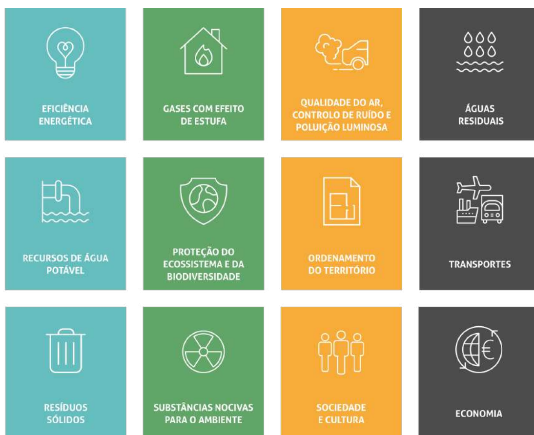
Figura 2 - Áreas de Atuação Chave

Associado a cada KPA, serão determinadas ações que serão desenvolvidas em toda a região, com vista à obtenção de padrões de sustentabilidade mais elevados.