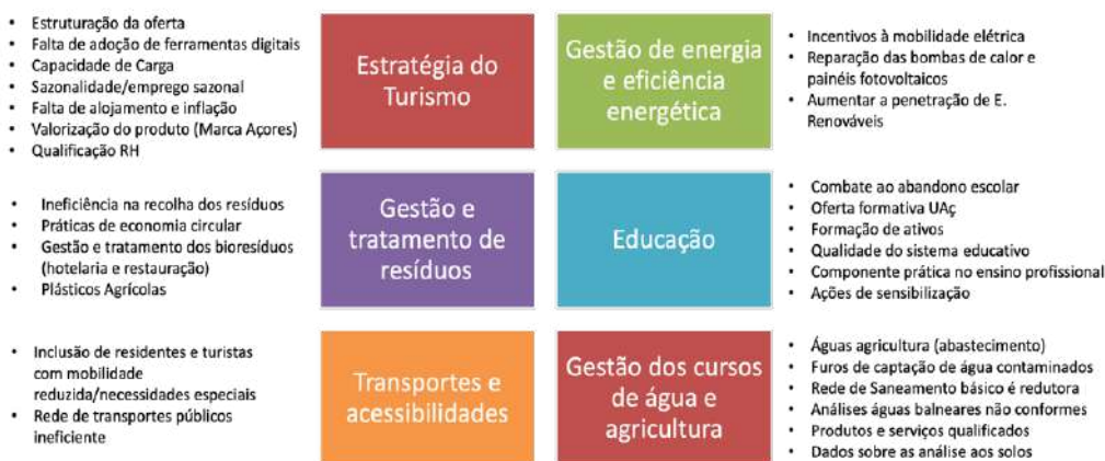
Figura 7- Estruturação das problemáticas a trabalhar no destino.

Nas reuniões com as Green Teams procedeu-se à hierarquização destas áreas, onde se identificou a Estratégia do Turismo como a mais prioritária a trabalhar, assim como a Gestão e Tratamento de Resíduos. Apesar da Educação se apresentar em último lugar, esta foi encarada como transversal para as demais áreas.